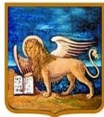
REGIONE DEL VENETO